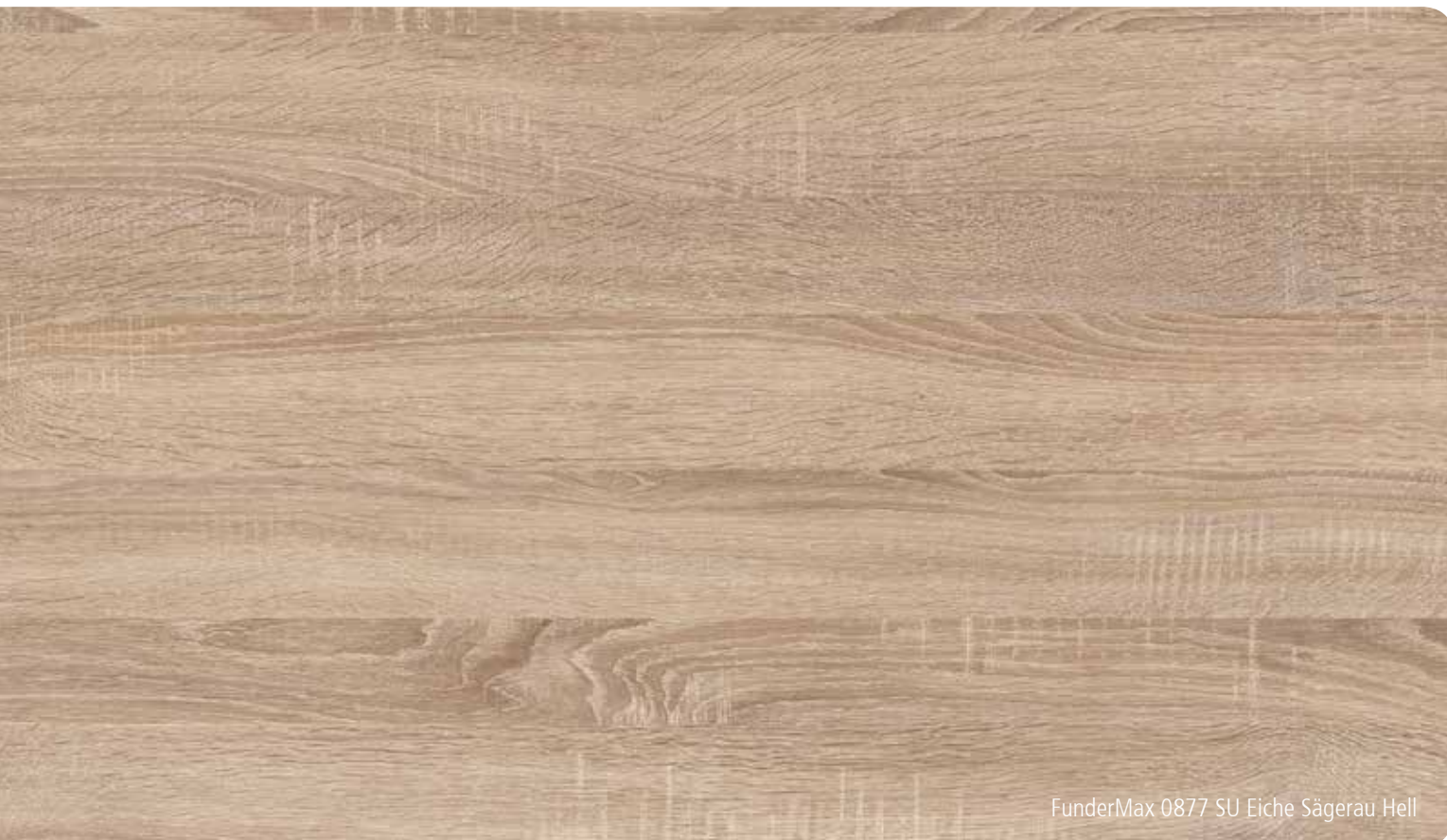
FunderMax 0877 SU Eiche Sägerau Hell