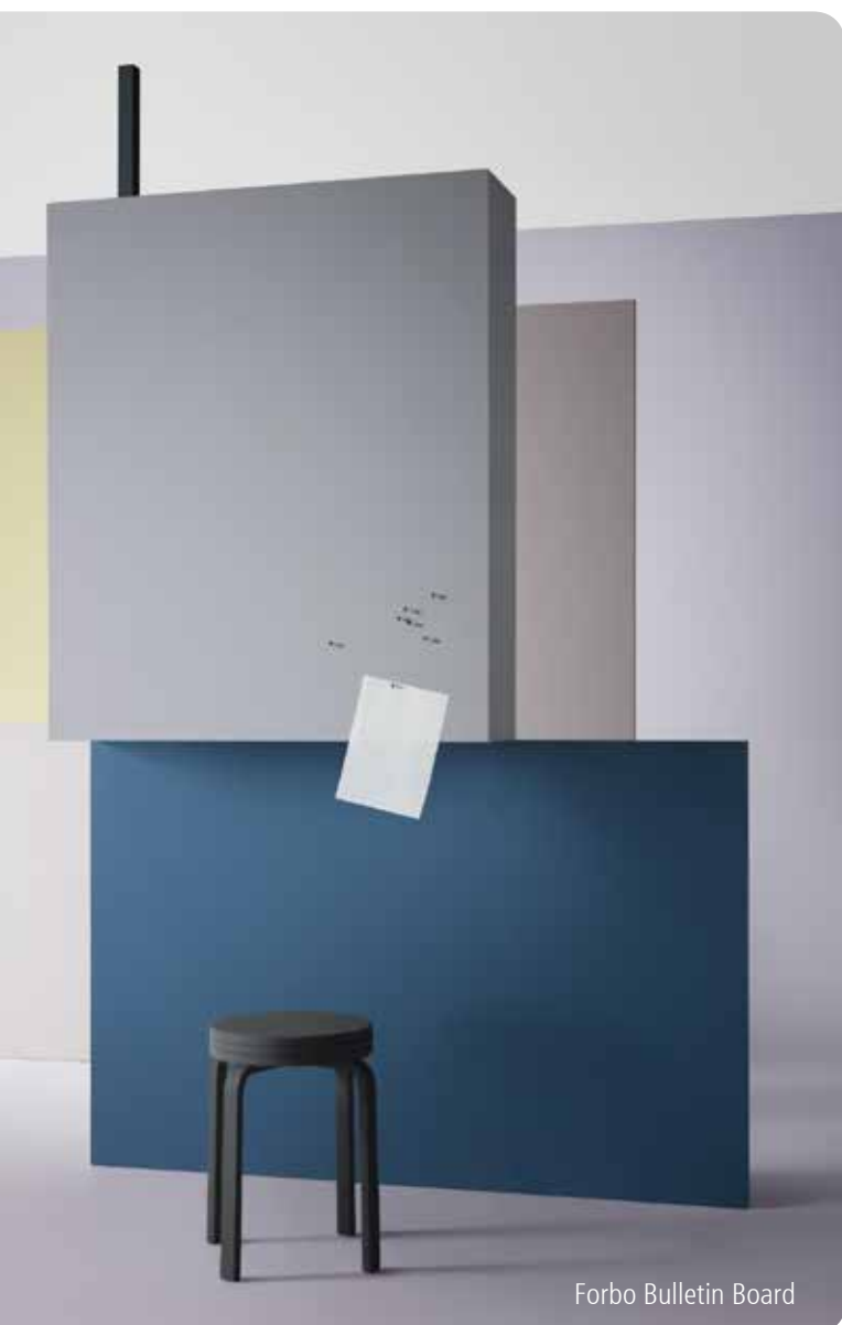
Forbo Bulletin Board