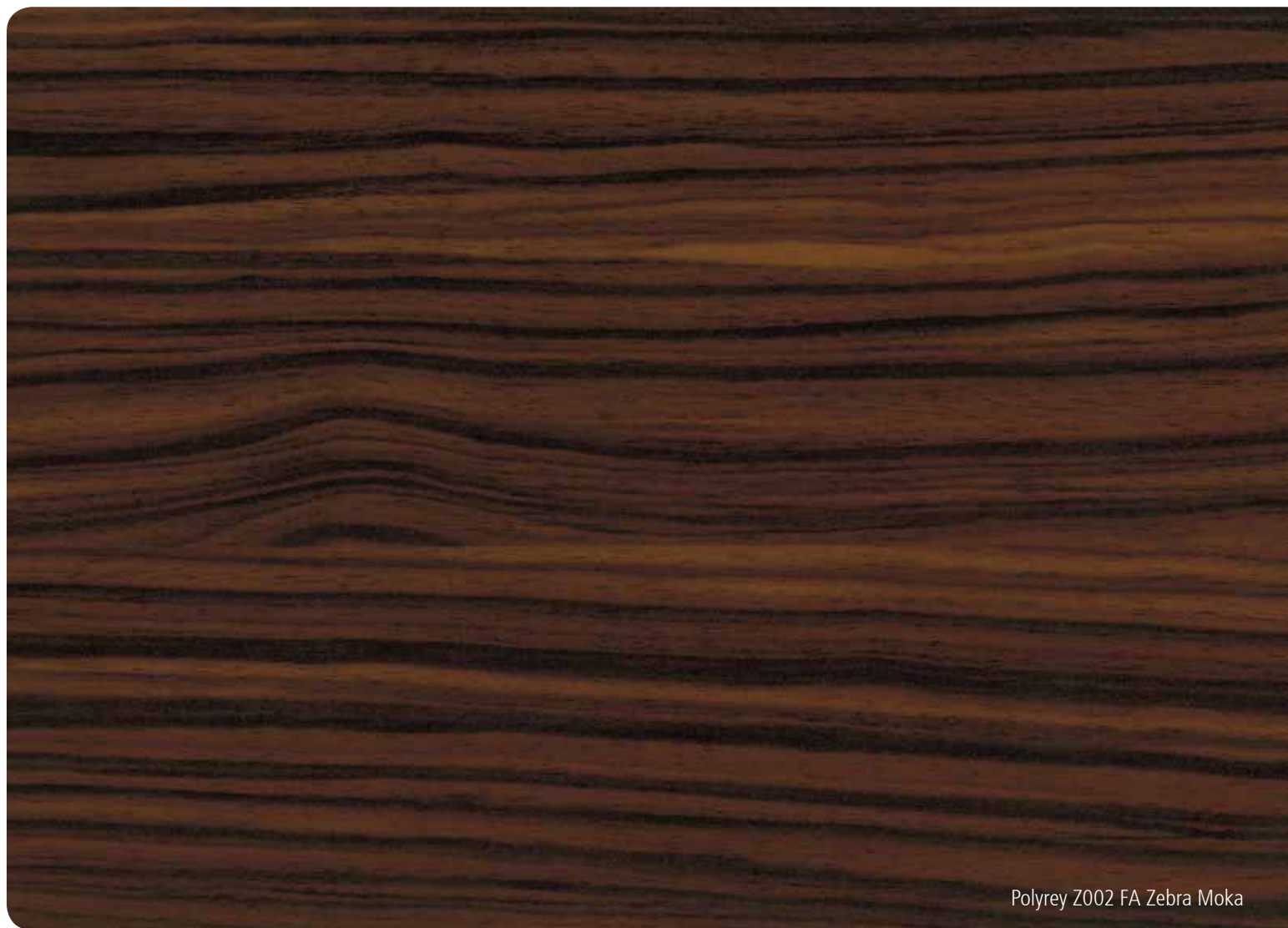
Polyrey Z002 FA Zebra Moka