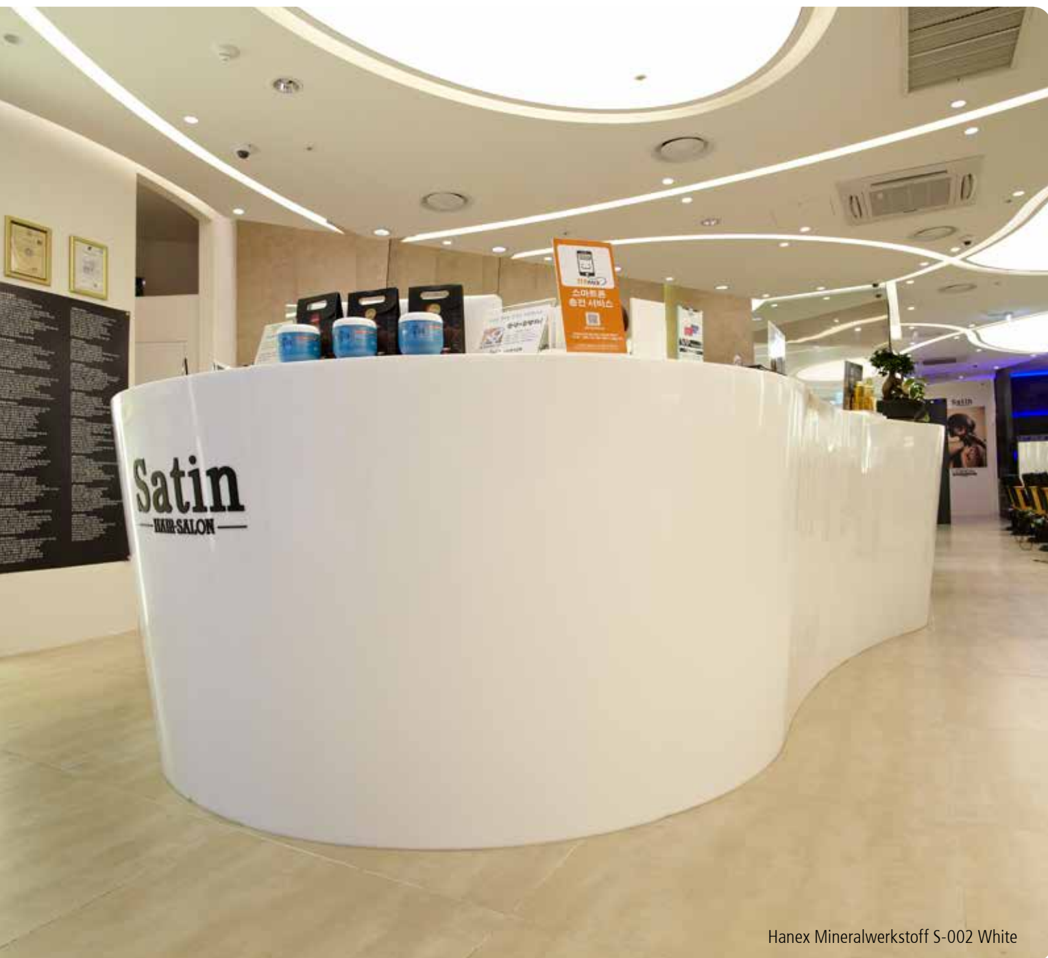
Hanex Mineralwerkstoff S-002 White