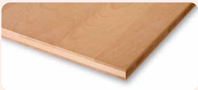
3-Schichtplatte Buche gedämpft A/B

Die 3-Schichtplatten bestehen aus einer oberen und einer unteren Schicht Massivholz, die in der Breite verleimt ist, und einer Mittelschicht aus einer keilgezinkten Platte. Alle drei Schichten haben die gleiche Holzart und sind kreuzweise miteinander verleimt. Die 3-Schichtplatten sind aufgrund ihrer Konstruktion viel stabiler, als die durchgehenden und keilgezinkten Platten.