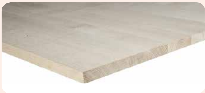
Leimholzplatte Erle A/B durchgehende Lamellen

Leimholzplatten sind einlagige Massivholzplatten, deren Holzleisten über die Schmalseiten verleimt werden. Die Leimholzplatte zeichnet sich durch ihre hohe Festigkeit in Faserrichtung aus.