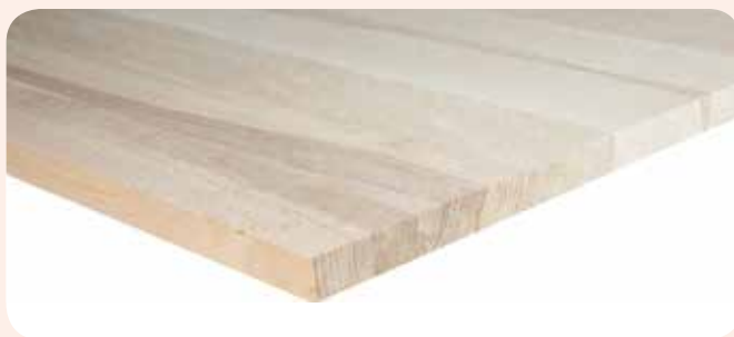
Leimholzplatte Kernbuche A/B durchgehende Lamellen