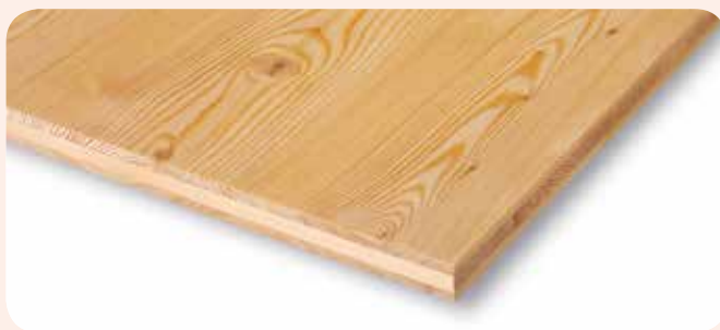
3-Schichtplatte Lärche europäisch