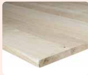
Leimholzplatte Eiche A/B durchgehend