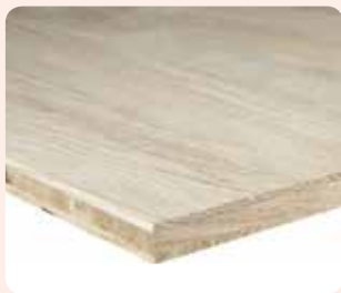
3-Schichtplatte Eiche europäisch A/B