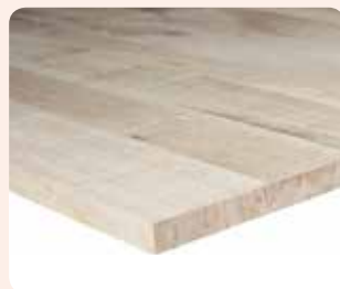
Leimholzplatte Eiche Rustikal / Eiche Rustikal astig