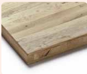
3-Schichtplatte Eiche Rustikal