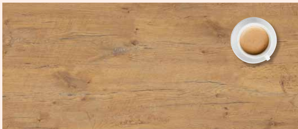
Pale Lancelot Oak | auch als Arbeitsplatte erhältlich

Eine große Auswahl an Arbeitsplatten und passenden Kanten finden Sie in der ZEG Kollektion Arbeitsplatten. Die Kollektion gibt es bei Ihrer ZEG, direkt von Ihrem ZEG-Außendienst oder auch zum Download unter unternehmen.zeg-holz.de/downloads