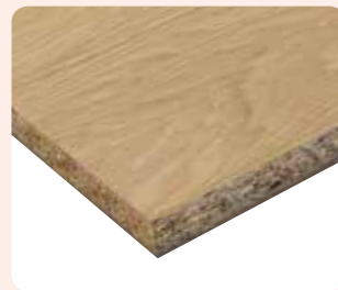
Furnierte Span Eiche schlicht A/B gemischt geschoben